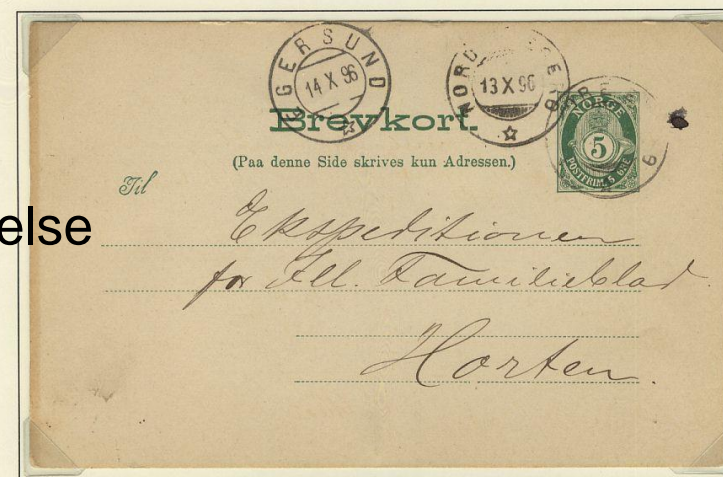
Brevkort stemplet SL "NORDRE EGERØ 13 X 96", transittstemplet TL "EGERSUND 14 X 96". 5 øre porto for innenrikske brevkort fra 1877 til 1919. Stempelet var utsendt 16.6.1894, og det var i bruk til 13.6.1907.

På gården Skadberg ble det opprettet poståpneri 1.7.1894. Poståpneriet ble benevnt Nordre Egerø. I 1904 ble det endret til Nordre Ekerø, og 1.10.1921 til Nordre Eigerøy. Poståpneriet ble nedlagt fra 1.9.1965.