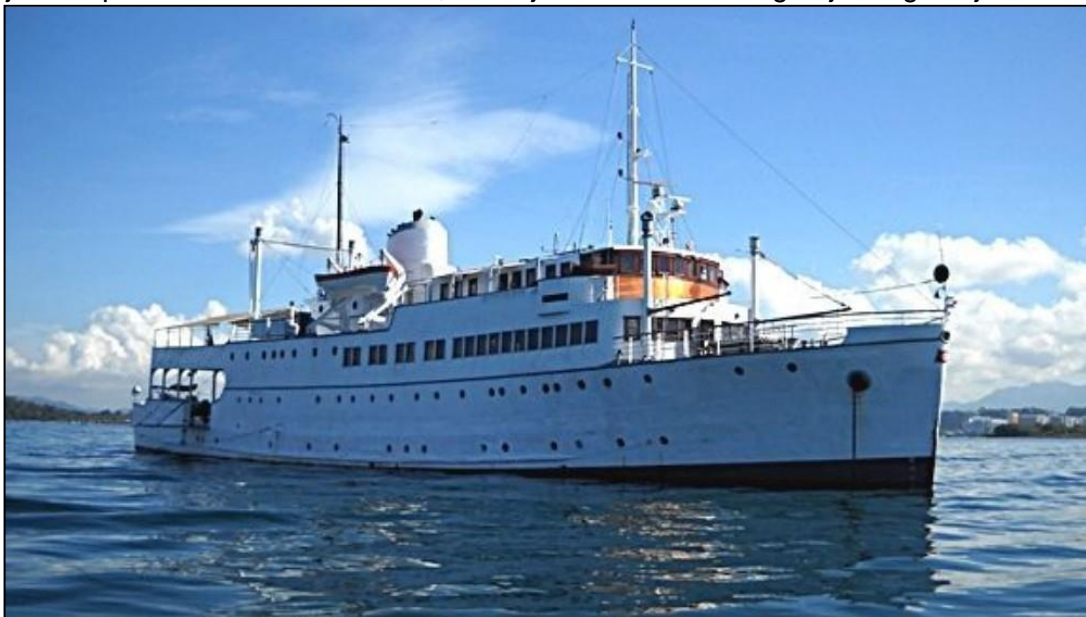
M/S Sognefjord/Orient Explorer i dag. Fortsatt med Fylkesbåtane sin logo i baugen.

Lokale ildsjeler har forsøkt å få skipet hjem, foreløpig uten hell. Støtte fra Riksantikvaren er lite trolig, da det er gitt støtte til M/S Sunnhordland, som er tilsvarende skipstype og som er vel hjemme på Stord. Men en vet aldri, kanskje kommer M/S Sognefjord også hjem?